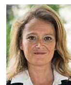
Olivia Grégoire Assemblée Nationale