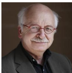
Erik Orsenna Economiste, écrivain, membre de l'Académie Française