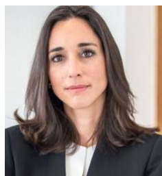
Brune Poirson Ministère de la transition écologique et solidaire